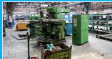
STROJE A ZAŘÍZENÍ