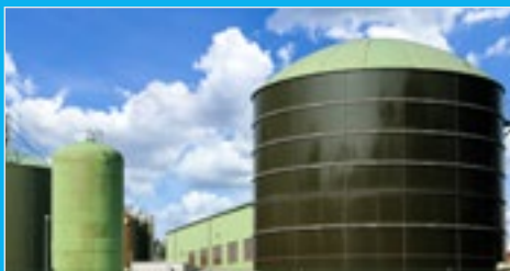
NÁDRŽE A ZÁSOBNÍKY